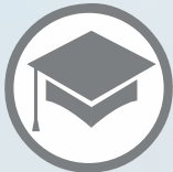
Coordinadores Académicos Regionales

Establece la dirección general académica, administrativa y presupuestaria de la Academia. Lidera la comunidad educativa, buscando mantener la confianza y cooperación de cada uno de los integrantes de la Institución. Guía a los equipos potenciando la identidad y compromiso para el logro de objetivos que emergen desde la misión. En materias educativas puede ser asesorado por el Consejo Académico.