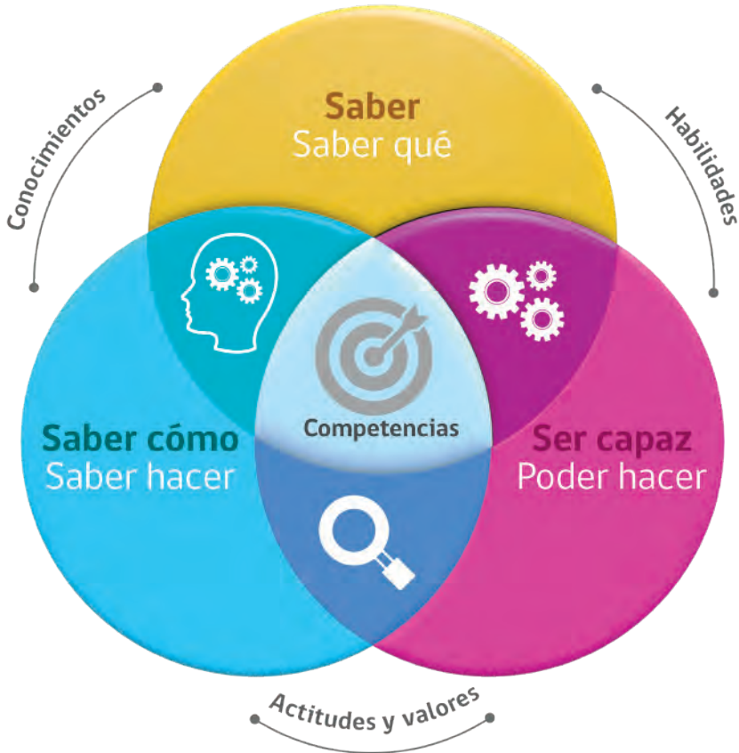
Representación de competencias (2018).

Las tendencias educativas contemporáneas apuntan hacia modelos educativos basados en competencias, siendo este el enfoque que toma el proyecto educativo institucional (PEI) de la ANB. Estas tendencias se evidencian en el mundo de la educación superior, como en el caso del Espacio Europeo de Educación Superior (Comisión Europea, 2022) o los esfuerzos en este mismo sentido para Latinoamérica (Macías, 2020). Es preciso contextualizar estos elementos en un proceso distinto y particular, como es el caso de la formación bomberil en Chile. Por tanto, más que una adopción completa de un